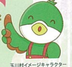
玉川村イメージキャラクター 山崎のクックちゃん